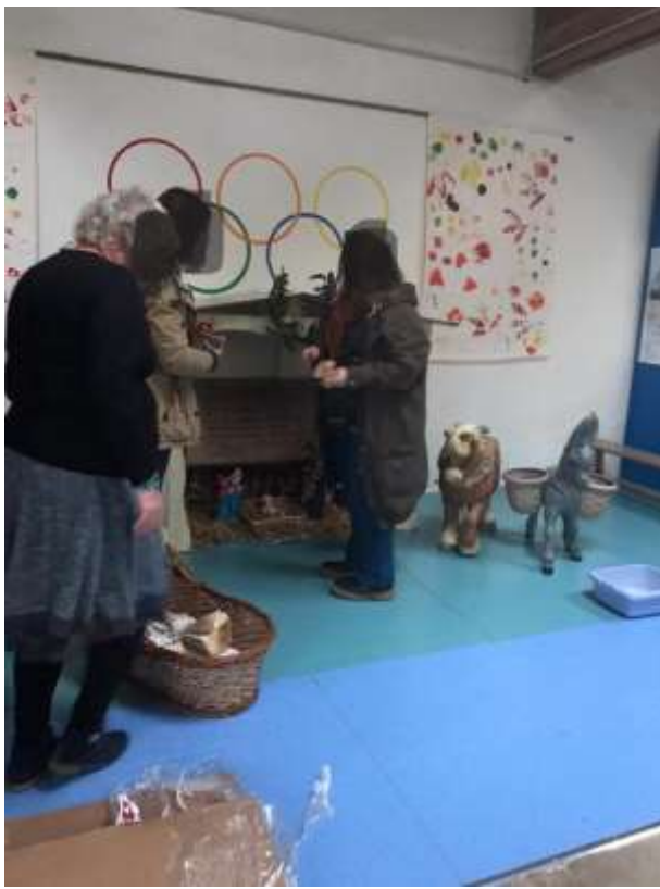
(Deux membres de L'APEL et une maman de l'un de nos membres)

Nous avons utilisé un projecteur de chantier pour une meilleure luminosité lors de la photo finale de notre crèche.